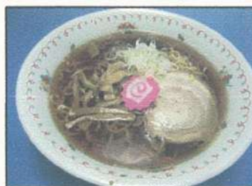
醤油ラーメン Soy sauce ramen