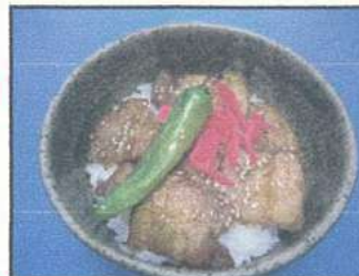
豚丼 (Pork bowl)