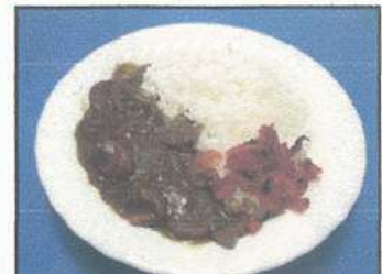
カレーライス (Curry and rice)