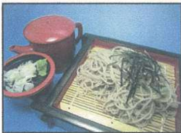
ざるそば(かけそば) Buckwheat