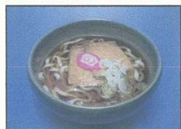
かけうどん Wheat noodle